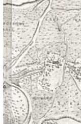
Ryc. 5. Użytkowanie ziemi w okolicach Chwaliszewa w XVII wieku.