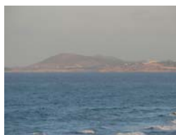
Fot. 2. Widok na Wyspy Liparyjskie w 2010 roku.