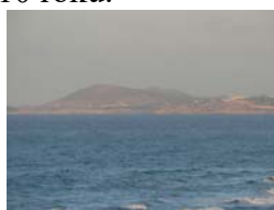
Fot. 2. Widok na Wyspy Liparyjskie w 2010 roku.